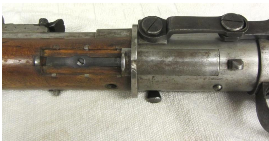
#001 Venstre side: Lade-/tømmepport for trommelmagasin Fig. 12

geværet åpnes ved å forskyve et lokk framover.