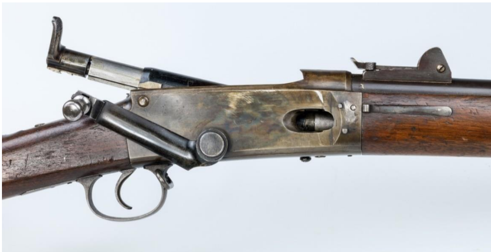
Magsinet er ladet