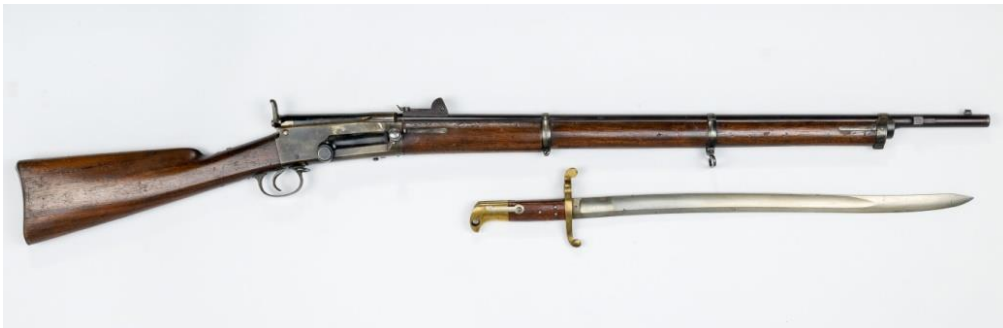
A0016473 Høyre side m/ bajonett M1860