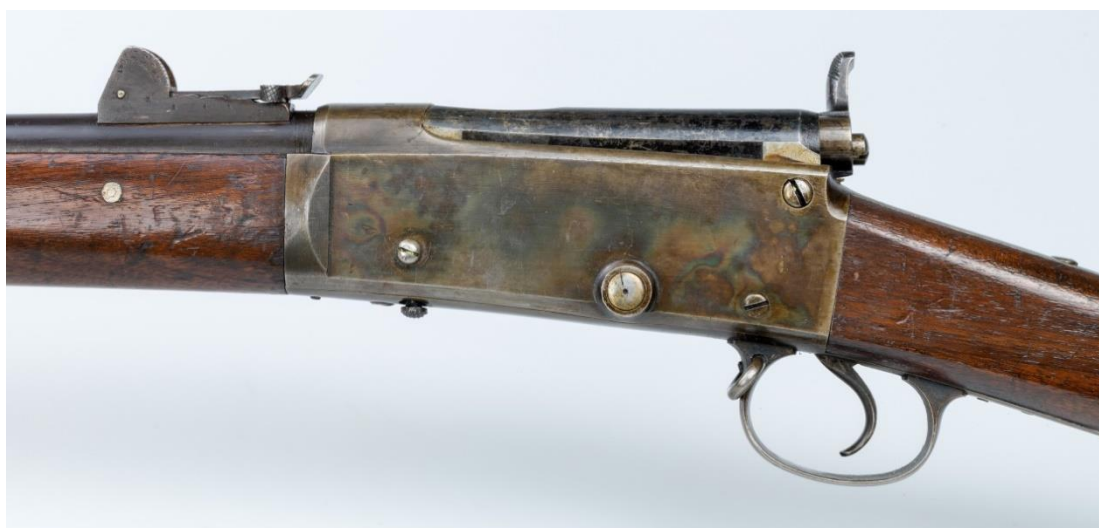
A0016517 Venstre side, lukket mekanisme