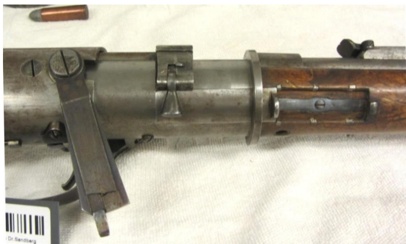
#010 Lukking med stengt lade-/tømmepoort