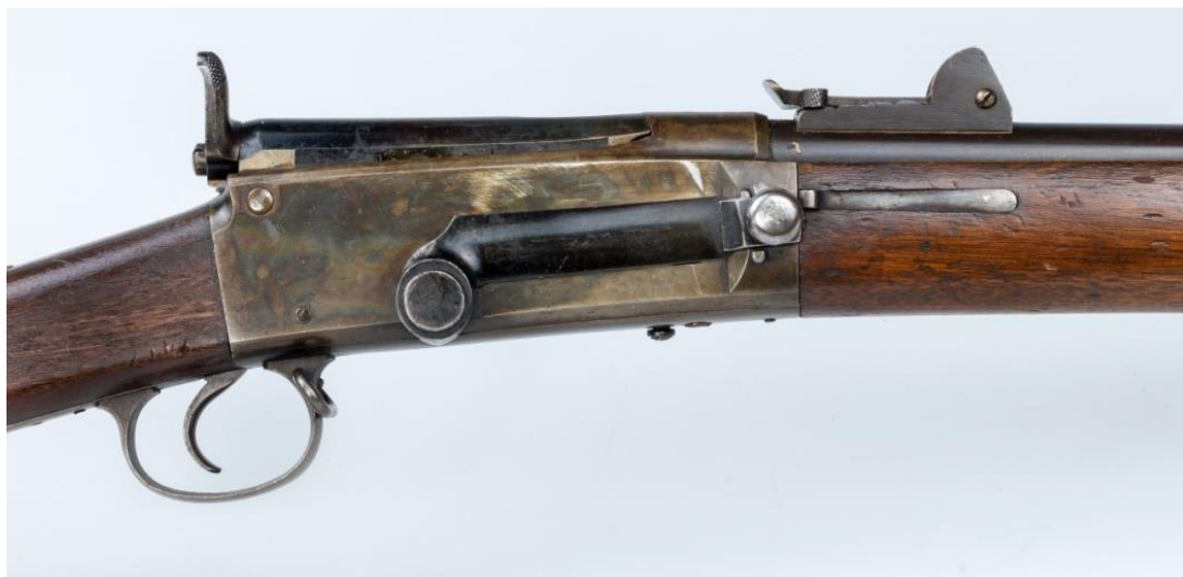
A0016522 Høyre side, lukket