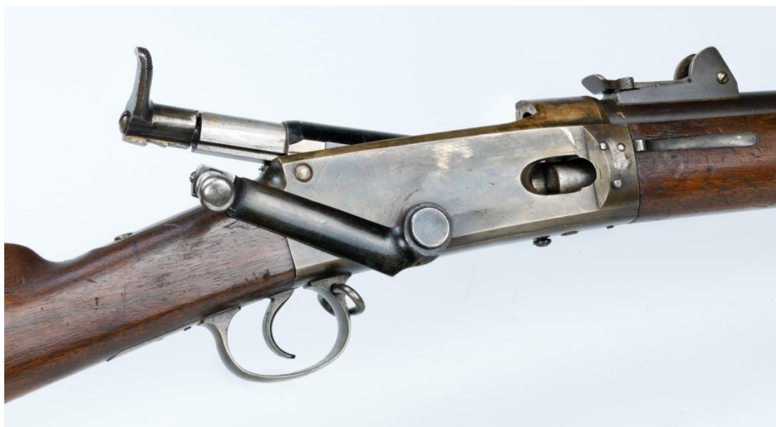
Foto: FMU A0016529 Mekanismen åpnet for lading (enkeltkudd eller rørmagasin)