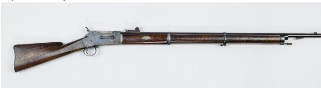
Høyre side

Det er umulig å vite hva som eventuelt skiller 1872-prøvegeværet fra dette. Men det er ikke usannsynlig at det har vært mange likhetstrekk.