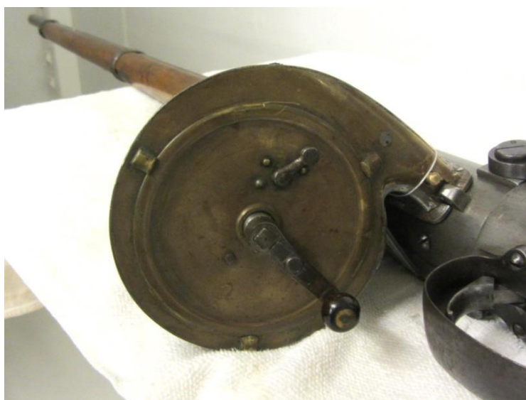
«0015 Sveiven er for spenning av fjær/fylling Fig. 15