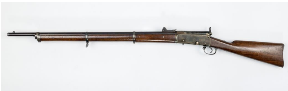
Venstre side