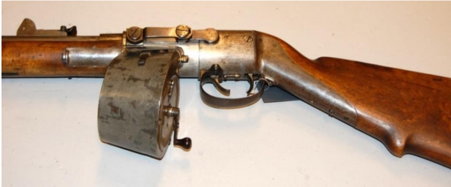
#06 Dr. Sandborgs magasingevær SN 5 merket KV og 1872. Fig. 1