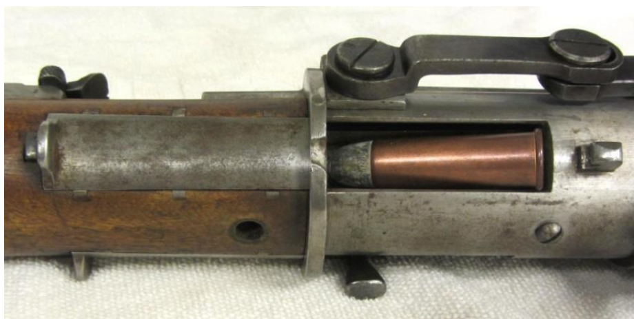
#002 Lade-/tømmepport for trommelmagasin. Kan også benyttes for lading av magasinet, på samme måte som for høyre ladeport