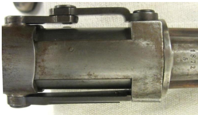
#009 Lukket sluttstykke sett ovenfra Fig. 7

I tillegg til lade-/tømmeporten på venstre side (Fig. 12, 13) for trommelmagasinet) er geværet også utstyrt med en kombinert la-