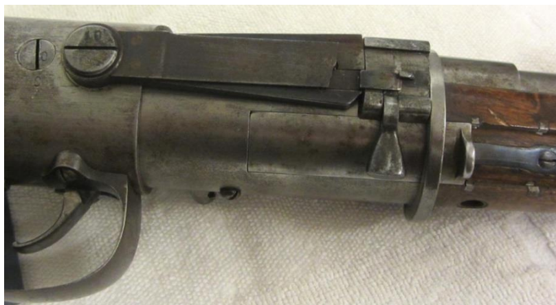
#008 Lukket sluttstykke, lukket ladeport