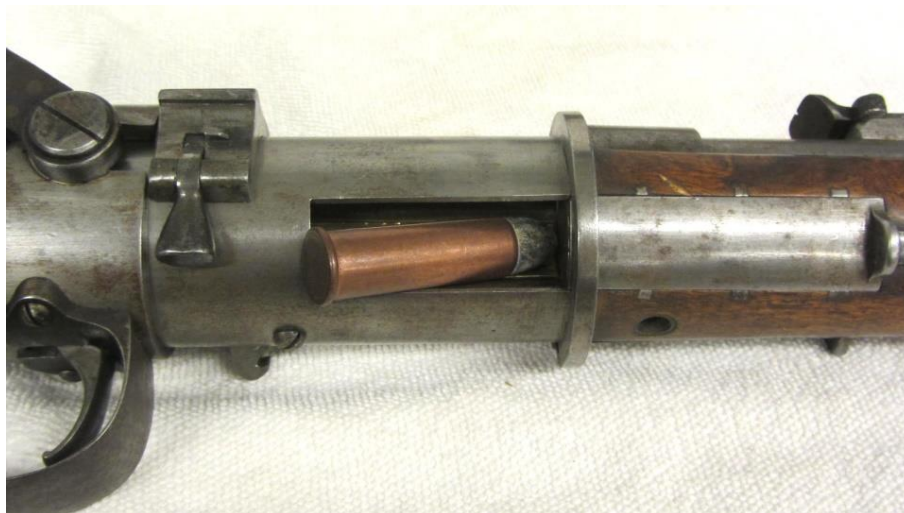
#005 Åpent sluttstykke, åpen lade-/tømmepport