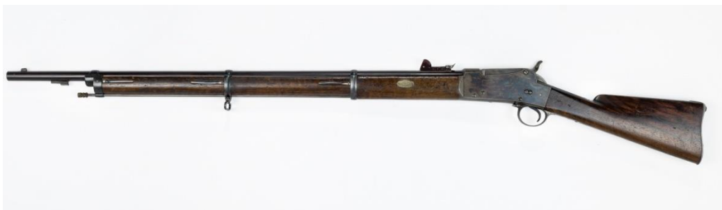
A0016472 Venstre side