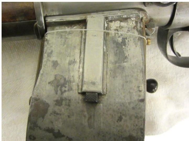
#013 Trommelmagasin låst til geværet Fig. 17