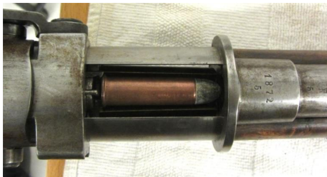
#003 Sluttstykket i bakre stilling. Ladning for enkeltskudd Fig. 5

Det synes også mulig å repetere skudd etter skudd med trommelmagasinet påkoblet geværet, og en har da inntil 25 skudd tilgjengelig, hvorav ett i kammeret.