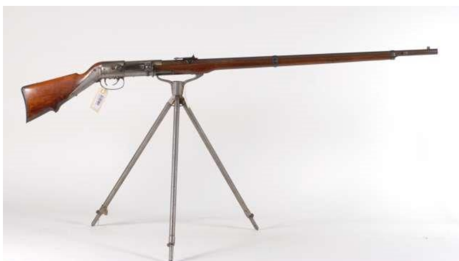
Magasingevær på tri-pod