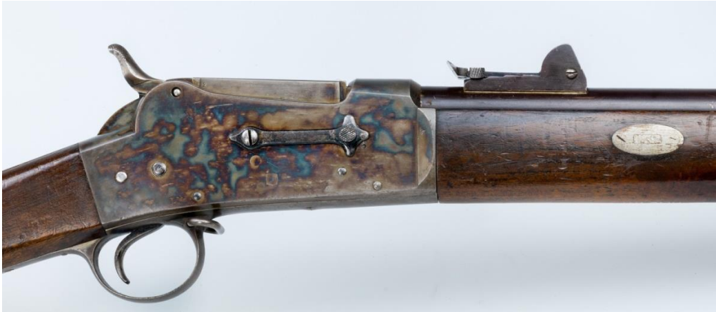
A0016511 Synlige forskjeller fra M1876: Hanegrepet, avtrekkers plassering i underbeslaget, magasinavstenger, plassering av baksiktet, bredden på framtreet samt feste av det, her med skyver. Fig. 35