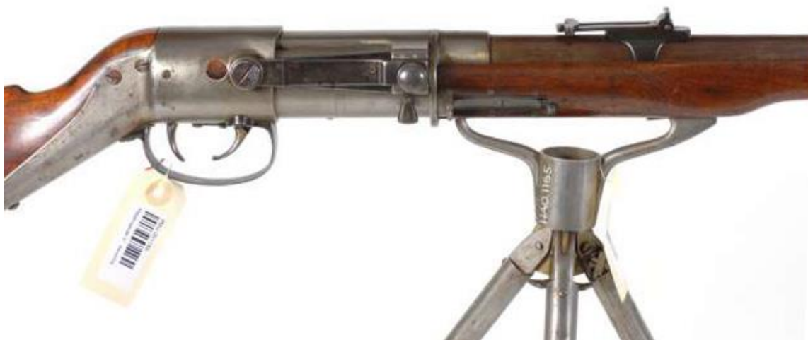
Foto: FMU 001165-8 Et av Sandborgs prøvegeværer (ikke SN 5 siden ladearmen her ikke er brukket, og det er annet sikte) Fig. 19